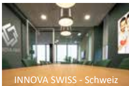
INNOVA SWISS - Schweiz